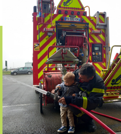
Lassay - Visite de la caserne des pompiers