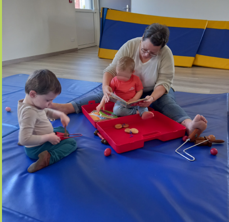
Son & Mouvement à Montreuil-Poulay