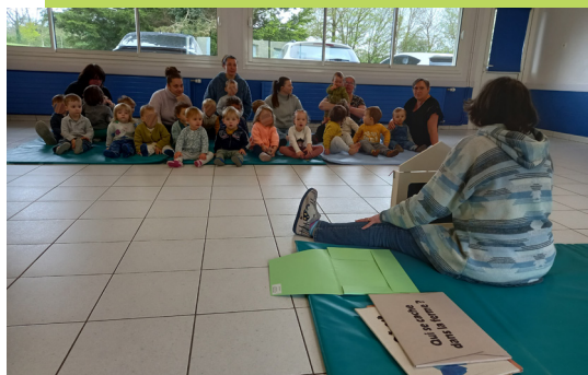
Mayenne - lecture Kamishibai par une assistante maternelle