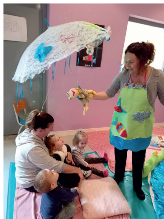
Marcillé la ville - Bien être des tout-petits