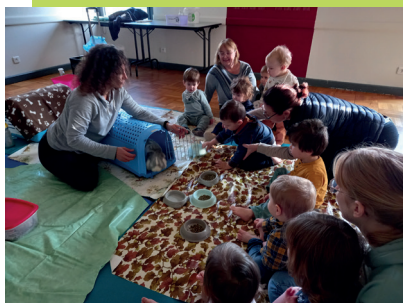
Charchigné - médiation animale