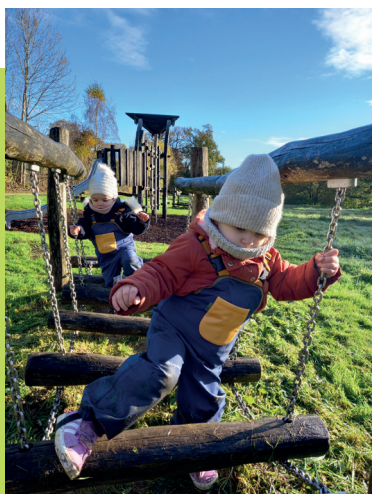
Parigné-sur-Braye - Promenade avec les salopettes extérieures empruntées auprès du RPE