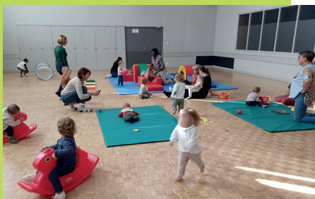
Nouveau lieu - Martigné sur Mayenne