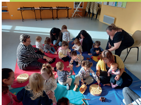
Contest - Son et Mouvement