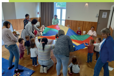
Moulay - jeu collectif du parachute