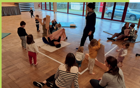
Jublains - Compagnie LABSEM dans le cadre de Croq'