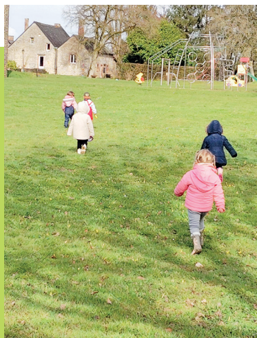
Promenade au Parc des Forges -Aron