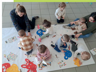
Dessins sur une fresque - Montreuil Poulay