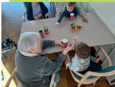
Nouveau lieu - Ehpad La douceur de vivre à Martigné sur Mayenne