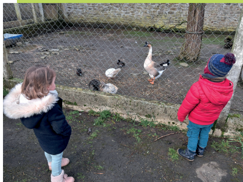
Promenade aux animaux du CHNM - Mayenne